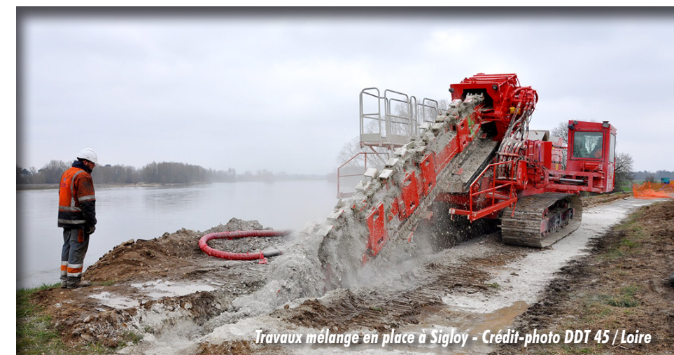
Travaux mélange en place à Sigloy

Ce programme pourra être adapté en fonction des conclusions de l'étude des vals du giennois en cours de réalisation ■